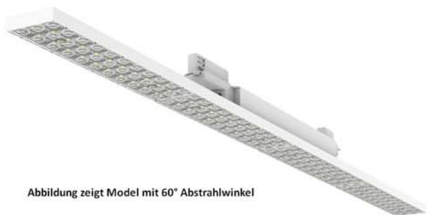
Abbildung zeigt Model mit 60° Abstrahlwinkel